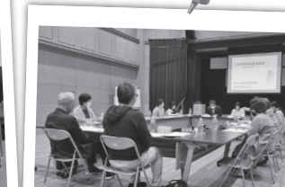
宇和地区 第2層協議体