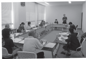
城川地区 第2層協議体

新任期でも、地域の現状や課題を共有しながら、関係者同士のつながりづくりや情報交換を進めていきます。地域の皆さまと協議を重ねることで、今後の支え合いの取り組みにつなげていきたいと考えています。引き続き、安心して暮らし続けられる地域づくりに向けて取り組んでまいります。