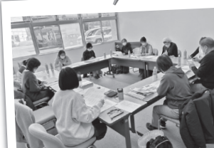
三瓶地区 第2層協議体