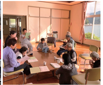
にここサロン (三瓶町)