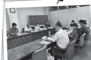
明浜地区 第2層協議体