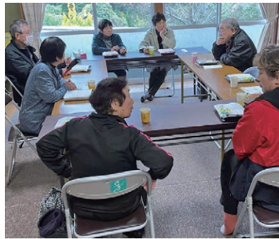
和みサロン (宇和町)

皆さまから寄せられた温かなご支援は、こうしたサロンの運営を支える大きな力となっています。