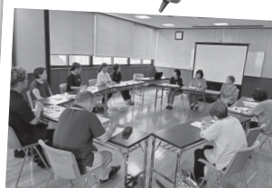
野村地区 第2層協議体