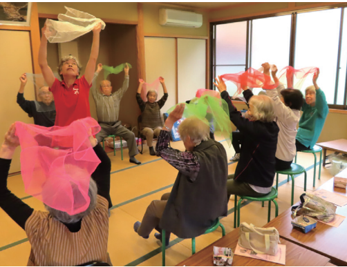
市内サロンでのミュージック・ケア