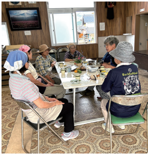
地区サロンでの おしゃべり