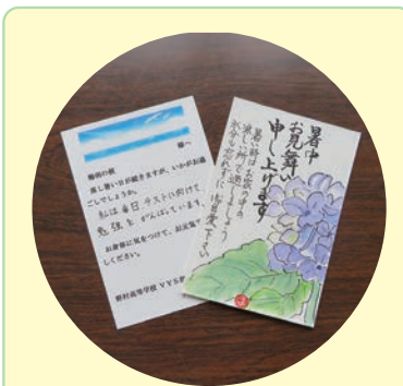
「ふれあい郵便」 (野村地区)

毎月、一人暮らしの高齢者に、子供たちや民生委員さんからのお手紙(ハガキ)を届けます。