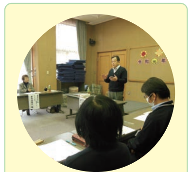
「在宅介護者の集い」 (宇和・明浜・三瓶地区)

毎月、一人暮らしの高齢者に、子供たちや民生委員さんからのお手紙(ハガキ)を届けます。