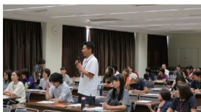
『高齢者の消費者トラブル・被害への対応について～経済的虐待～』の研修会の様子