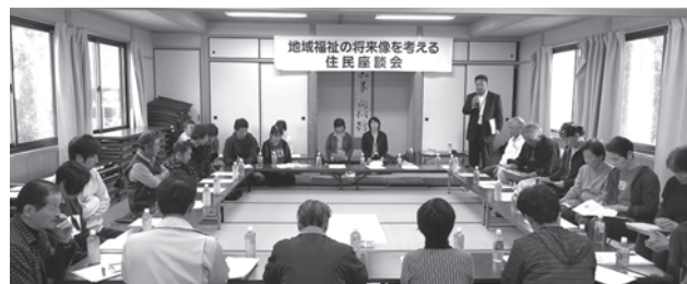
住民座談会（大野ヶ原地区）