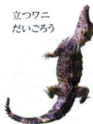
立つワニ だいごろう