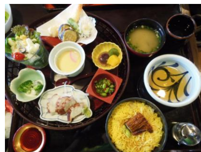
東洋軒 きほく庵 花かご膳