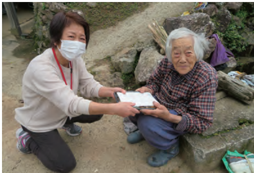
野村地区での訪問の様子

なお、野村、明浜、宇和、城川地区では、皆様からの『まごころ銀行』を事業の財源として活用しています。(三瓶地区は、共同募金の配分金が財源です。)