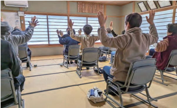
健康運動指導士さんをお招きしての体操教室