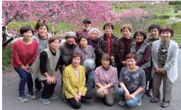
バスでお花見やブドウ狩りに出かけました