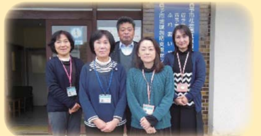
宇和・明浜・三瓶担当