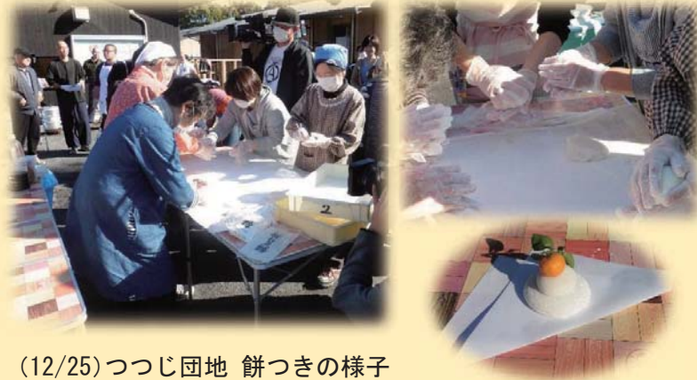
(12/25)つつじ団地 餅つきの様子

被災によるお困りごとなどのご相談に応じ、被災された皆様の生活再建を支援してまいります。