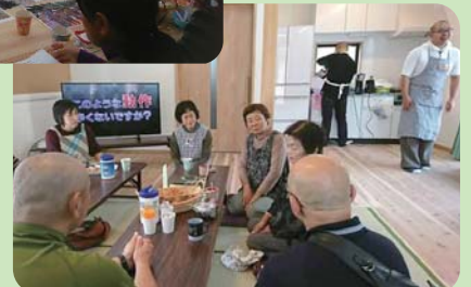
明間地区の様子 (午後開催) →