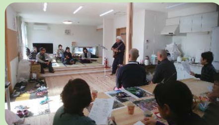
野村地区の様子 ← (午前開催)

発災当初から支援していただいている四国地区曹洞宗青年会が中心となり、原則毎週金曜日に、仮設住宅で『ほっとカフェ』が開催されています。毎週とても賑わっており、地域の憩いの場となっていますので、お近くの方はぜひご参加ください。お待ちしております♪